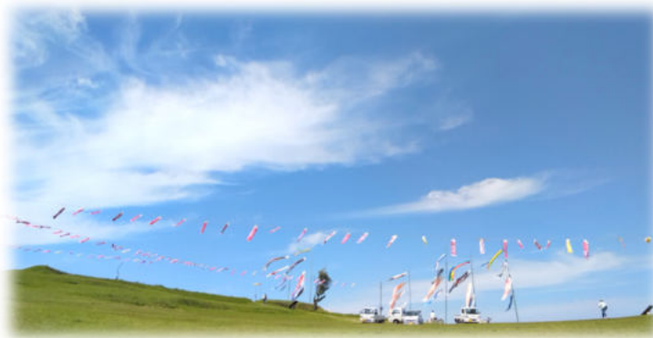
青空を優雅に泳ぐこいのぼり