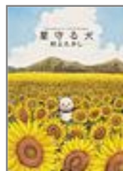
村上たかし 著 「星守る犬」