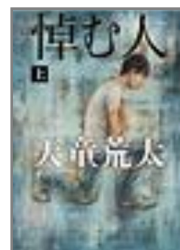
天童 荒太 著 「悼む人」 上・下

今月の新刊紹介 ～ 大震災という悲劇が教えてくれた「日本」の本当の実力とは? 「それでも「日本は死なない」これだけの理由」と映画化で話題の「星守る犬」、聖者なのか偽善者か…「悼む人」。