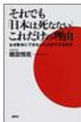
増田 悦佐 著 「それでも「日本は死なない」 これだけの理由」