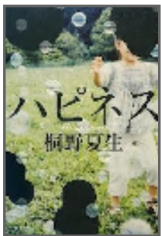
桐野 夏生 著 「ハピネス」