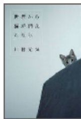
川村 元気 著 「世界から猫が消えたなら」