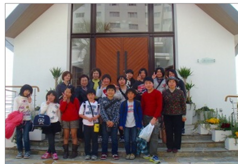
別府湾ロイヤルホテルのチャペルも見学しました

コミュニティ主催「子ども料理教室」では、3月9日に、別府湾ロイヤルホテルでテーブルマナー研修を行いました。。洋食のコースを、講師の方からナイフ・フォークの由来や使い方のタブーなどを学びながら、一品ずつ丁寧な説明を受け美味しくいただきました。子ども料理教室では、今年度4年生、6年生14名が、調理実習をしながら食の楽しさや大切さを学びました。