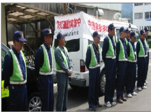
パトロールに臨む機動隊の皆さん

地区内で不審な点などありましたら自治会館まで一報ください。私たちは抑止しかできませんが、それが地区の安全、安心だと思いい年間活動を行っています。