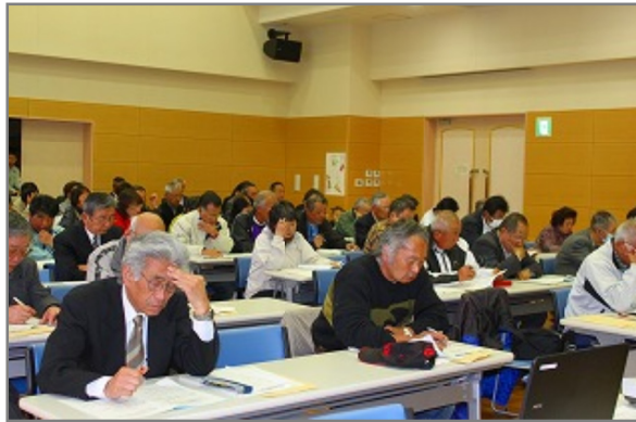
自治委員会総会に参加の皆さん