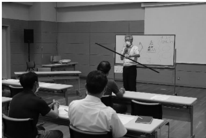
実際に使われていた道具

しい認識を全ての町民と共に」をテーマに講演をして頂きました。大権啓発推進DVD「家庭からふりかえる人権話せてよかった」と、玖珠郡部落史研究会編集・古老の語りから」は、玖珠自治会館で貸出しをしています。是非ご利用下さい。