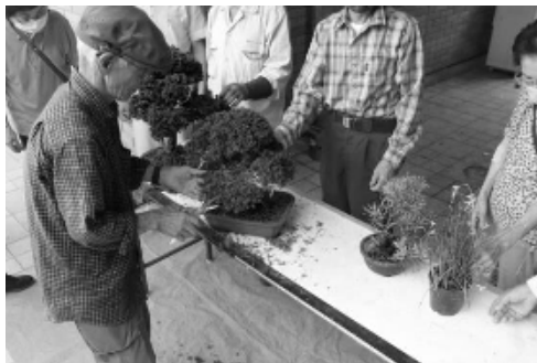
素敵な作品が並びます

現在会員は約15名です。個人指導もします。男性女性共に大歓迎です。興味のある方は是非見学に来ませんか？