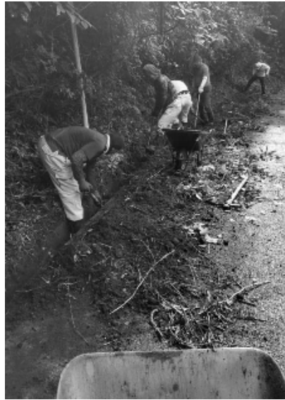
側溝に泥や草木が詰まっています

②支え合いマップ作り 社協の職員さん、民生委員さんと各自治区を訪問し、作成しています。支え合いマップとは、平時・災害時を問わず、自治区内の支援が必要な方、高齢者・子ども・障がい者等)に対し、見守りや声かけを実践する共助の仕組みづくりの為に地図です。