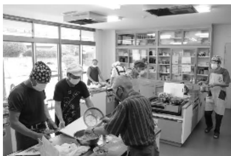
皆さん手際よく作業されています