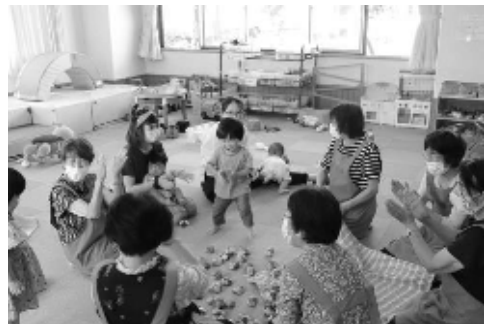
お手玉にちびっこも夢中