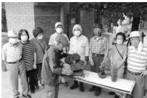
盆栽に触れながら仲間づくりしませんか？