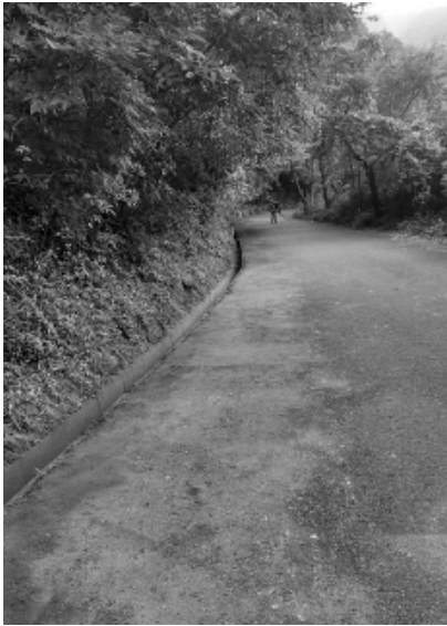
綺麗になりましたが、まだまだ先は長いです

①笹ヶ原く伐株山の道路環境整備 法面の草刈、雑木の伐採、側溝の掃除等です。数名の有志の方の力を借りていますが、距離が長く当分かかりそうです。