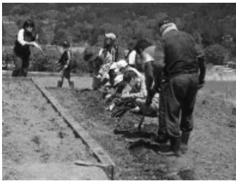
フジバカマの苗を植えました

アサギマダラは5月ごろ台湾方面から二千キロの旅をして、海を渡り日本に來ます。スナビキソウという花の蜜が好きで、スナビキソウが群生している姫島にたくさん飛来することです。