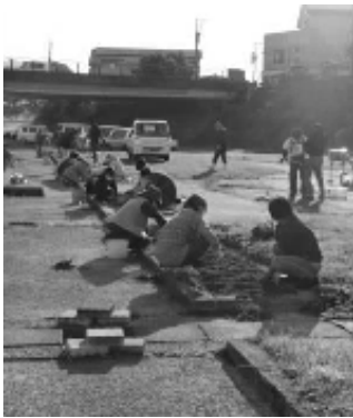
早朝からお疲れ様でした