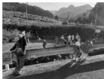
大谷翔平選手を中心に野球に夢中！