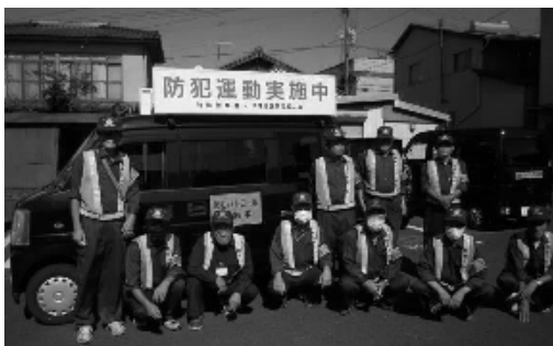
パトロールを実施した隊員の皆さん

防犯機動隊では随時隊員を募集しています。詳しくは玖珠自治会館(72-1511)まで。