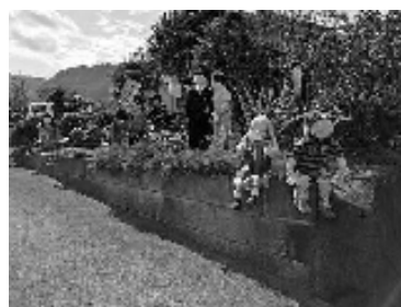
かかしがお出迎え