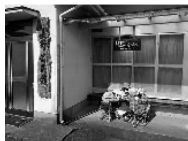
何やらおしゃべりに花が咲いています