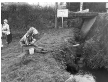
大物が釣れるかな？