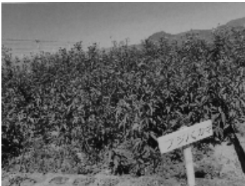
こんなに立派に育ちました