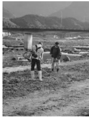
ビーパーを使った草刈り作業