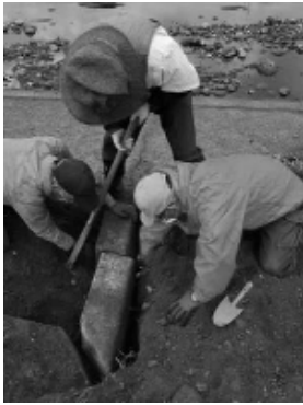
石を取り除く前準備作業

その為、河川敷整備の前準備を10月17日(土)、生活環境部会の6名で土を掘り起こし花壇の形を整えました。前準備を終えて、10月24日(土)にコミュニティ役員・部会員・塚脇自治委員・塚脇女性部合計32名の協力のもと、河川敷の花壇10ヶ所の花植え(ペンジー・ビオラ)と草刈りを行いました。河川敷整備をすることで最適な環境になり、散歩・ジョギン