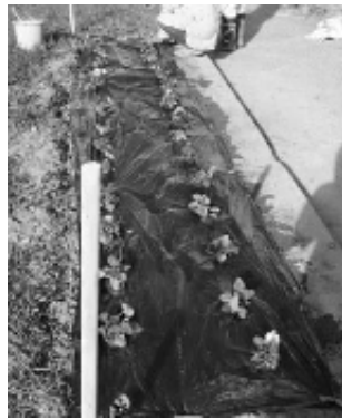
綺麗に整備された花壇