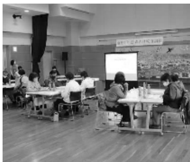
積極的な意見交換が行われました

認知症の人への声掛け等の対処法を学ぶ「声かけ模擬訓練」が10月23日(土)に玖珠自治会館集会所にて行われました。