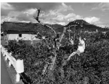
アスレチックが楽しそうです