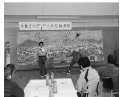
臨場感満点の寸劇