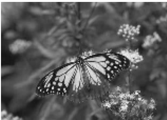
こんな蝶見たことありませんか

日本にやってきたアサギマダラは徐々に北の涼しい場所に移動します。その地で世代交代し、涼しくなるとあたたかな台湾や南西諸島に戻っていくのです。その南下の途中に休憩してもらおうと、いろんな取り組みを各地でしています。小田もその休憩地の一つになればいいと、今回の試みに至りました。