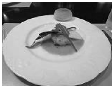
美味しい料理を頂きました