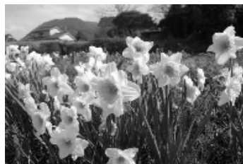
水仙のいい香りが漂っています

改がこさほて がに植仙す。小 め地のれどい地立丁栽が。小 て域よて前た域て寧さ畑約田 実をういかだの方てに名種 感支なるとらいた方てありす しまえ地道の仙とお話の ました宝なこのころ、聞の の動で入、聞か だこすれ20か とそ。を年せ