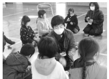
名人の技に興味津々