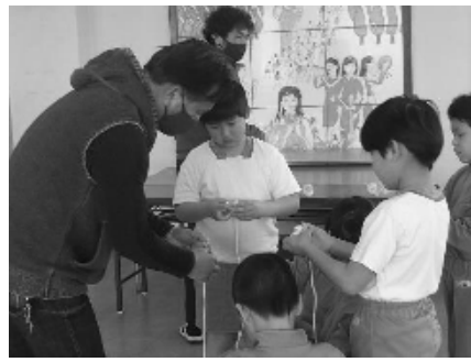
上手く回せるコツを伝授

何年もやってはいるけど忘れてる、頭の体操にもってこい』何度も練習してきたけど、ドキドキした！』と皆さん真剣でした。 出来ない悔しさに泣いてしまう子には孫をあやすかのように励まし、成功したときは一緒に飛び跳ねる勢いで喜ぶ皆さんの姿に、これぞコミュニティースクールの精神だと私も感動しました。子供たちの一生懸命な姿に逆に力をもらった、参加させてもらってよかった」とのお声やお礼の手紙も頂き、嬉しい内容にヤッター！。