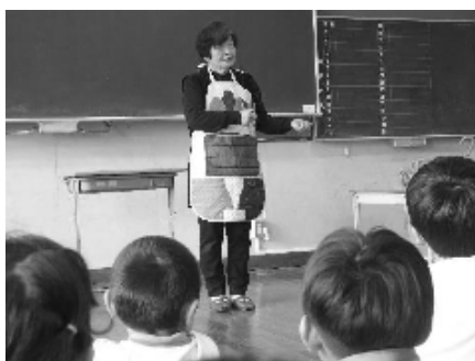
何が飛び出す!? エプロンシアター