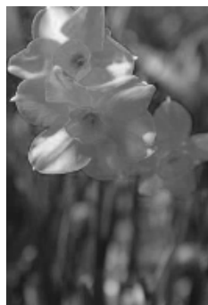
大輪の花が咲いています

改がこさほて がに植仙す。小 め地のれどい地立丁栽が。小 て域よて前た域て寧さ畑約田 実をういかだの方てに名種 感支なるとらいた方てありす しまえ地道の仙とお話の ました宝なこのころ、聞の の動で入、聞か だこすれ20か とそ。を年せ