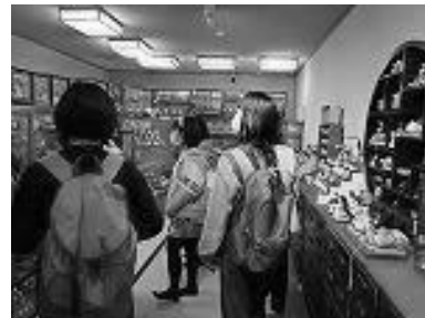
綺麗なお雛様を見学