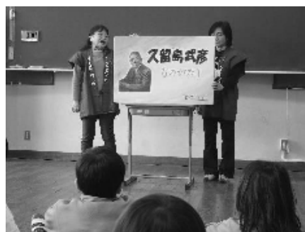
「ひこわの会」の皆さんの熱演