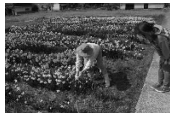
日々の手入れの賜物です