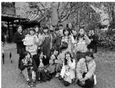
楽しい思い出が出来ました!

令和3年度も4月より子ども料理教室の募集を行います。申込み用紙は塚脇小学校・玖珠自治会館窓口に置いてあります。