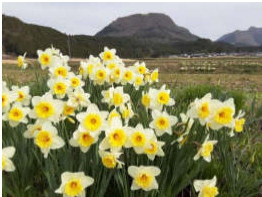
伐株山をバックにゆらゆらと