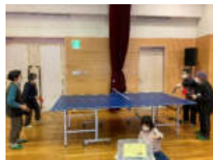
卓球で体を動かしました