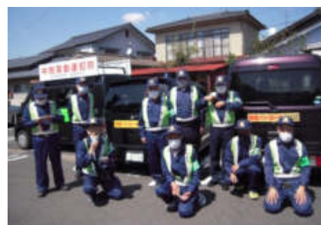
パレードに臨む機動隊の皆さん

隊員も3名増員して新規に役員も変わり、今年度もより一層活動に努めてまいりたいと話されています。皆様のご協力をお願いいたします。