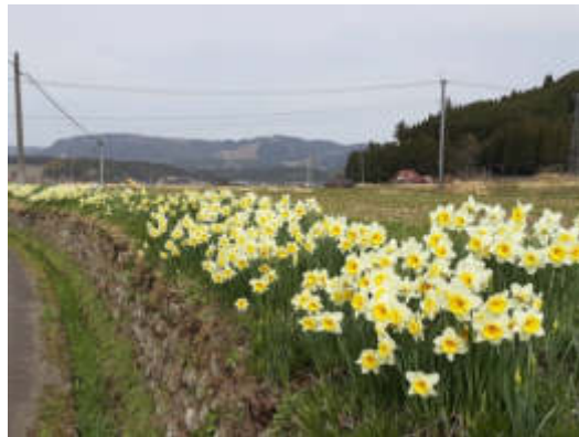
道路沿いのスイセン