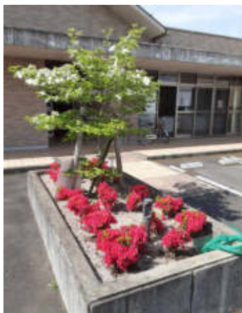
色あざやかなつつじ

この時期は事務室から見える国道沿いのしだれ桜や、ハナミズキ、鮮やかなつつじ等に癒されました。新緑が美しい季節へと移っていきます。